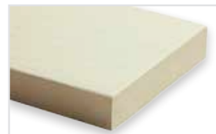
222 - Pearl