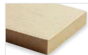
545 - Sand