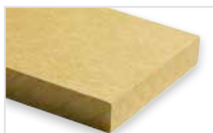
565 - Amber