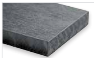
070 - Flint