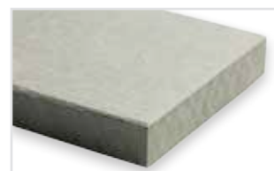
020 - Granite