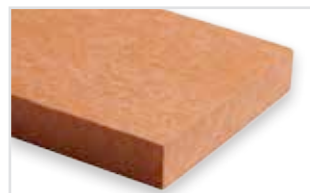
323 - Magma