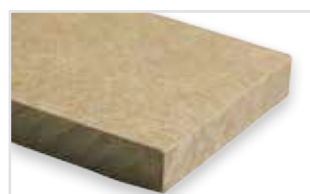
313 - Tufa