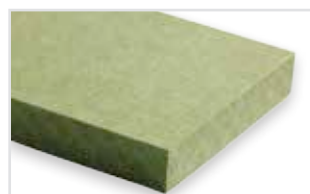
626 - Emerald