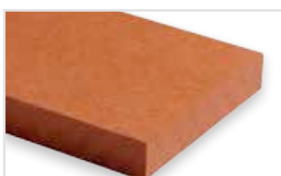
343 - Ruby