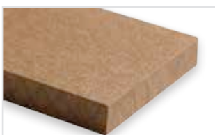
333 - Adobe