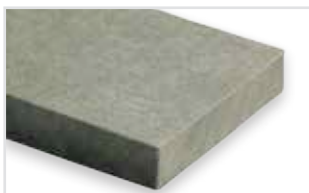
050 - Grafite